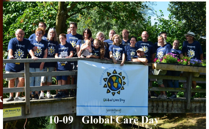
10-09 Global Care Day