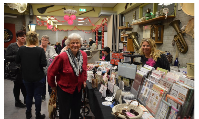
28-10 Lady's Night