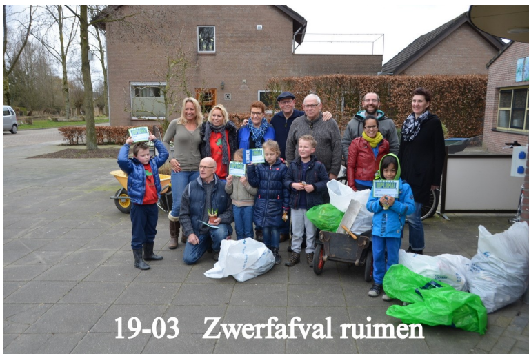
19-03 Zwerfafval ruimen