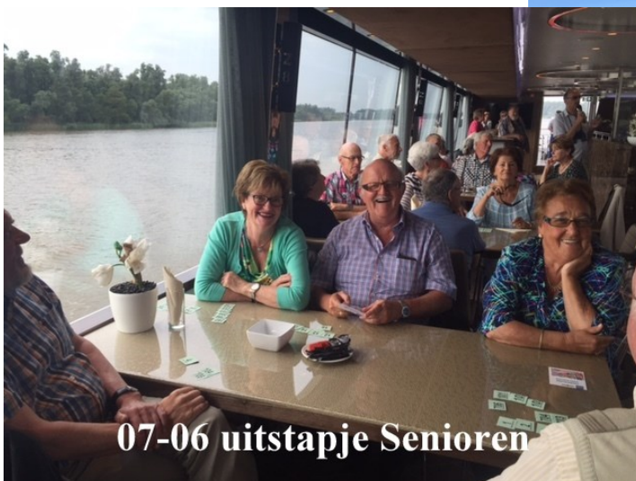
07-06 uitstapje Senioren