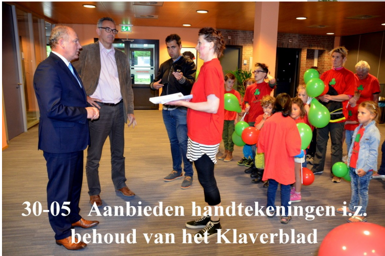
30-05 Aanbieden handtekeningen i.z. behoud van het Klaverblad