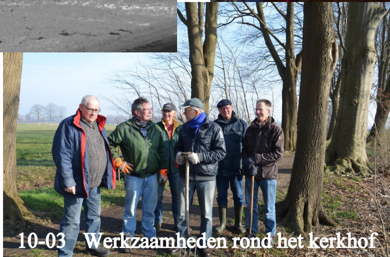
10-03 Werkzaamheden rond het kerkhof