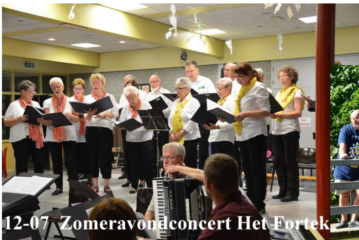
12-07 Zomeravondconcert Het Fortek