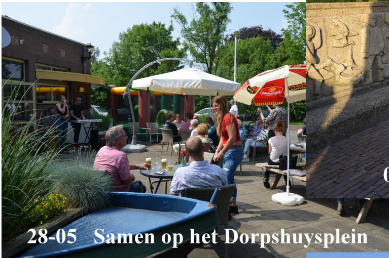
28-05 Samen op het Dorpshuysplein