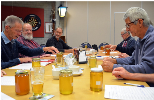
18-10 De imkers proeven elkaars honing