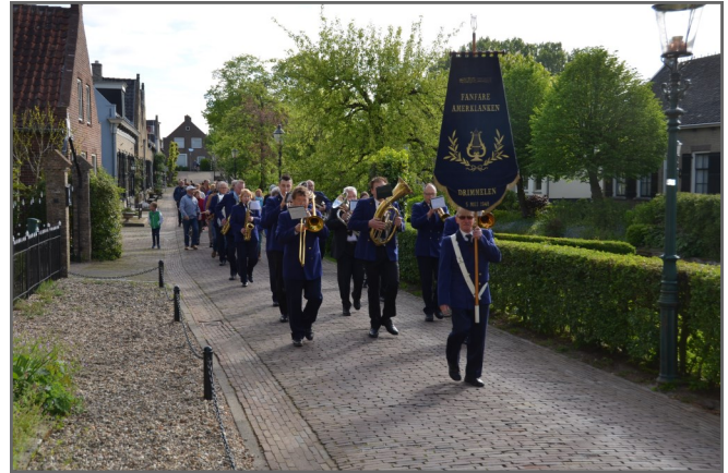
2015 - Dauwtrappen naar Oud-Drimmelen

De film "Biesboschvolk" wordt opgenomen.