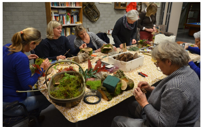
16-11 Knutselavond Takkenwijfjes