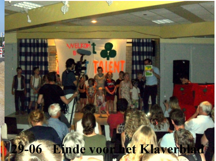
29-06 Einde voor het Klaverblad