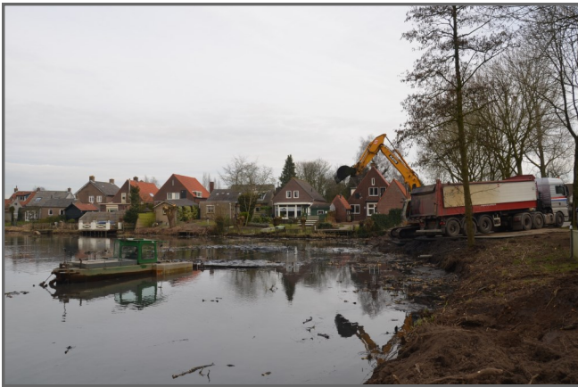
2013 - De Put wordt uitgebaggerd