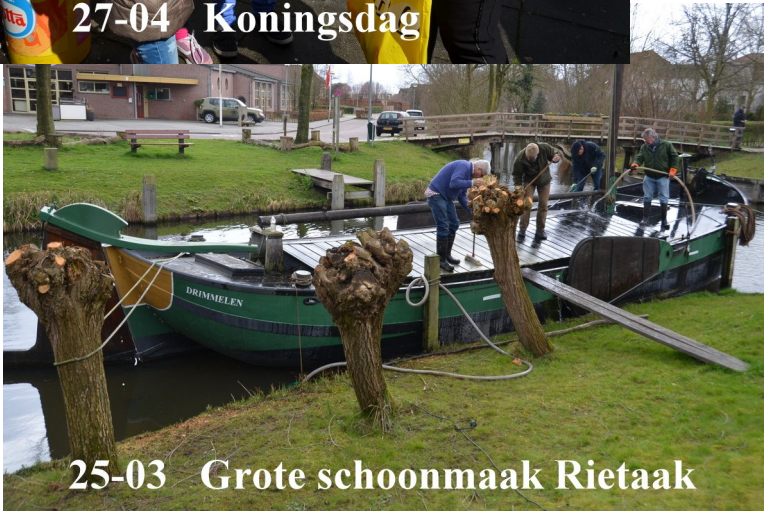
25-03 Grote schoonmaak Rietaak