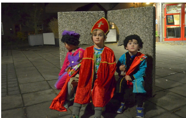
16-11 Vol verwachting klopt ons hart