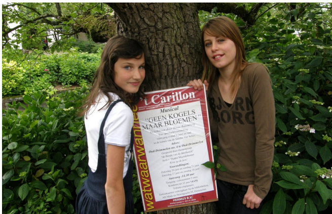
2009 - Musical Geen Kogels Maar Bloemen