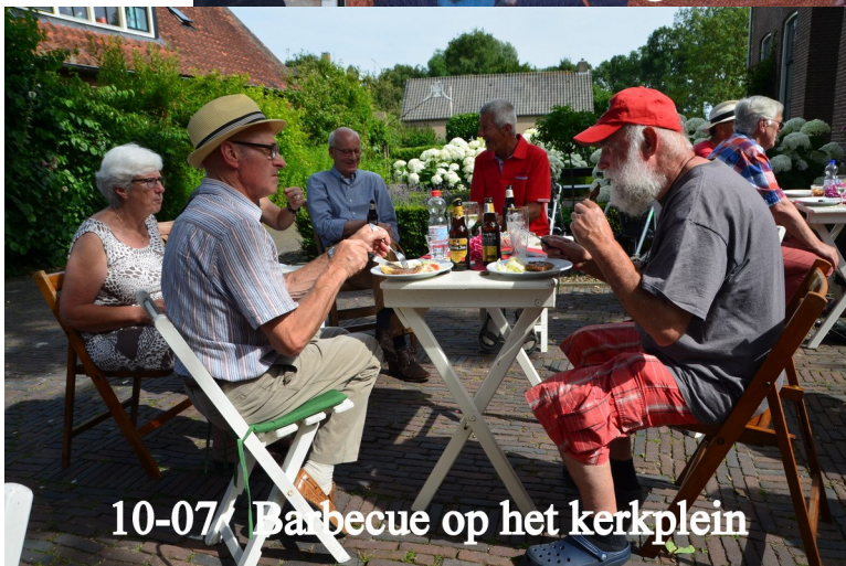
10-07 Barbecue op het kerkplein