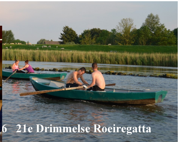
06-05 21e Drimmelse Roeiregatta