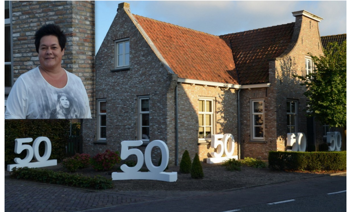
7-10 Josée Vermeulen 50 jaar, Stationsweg 7