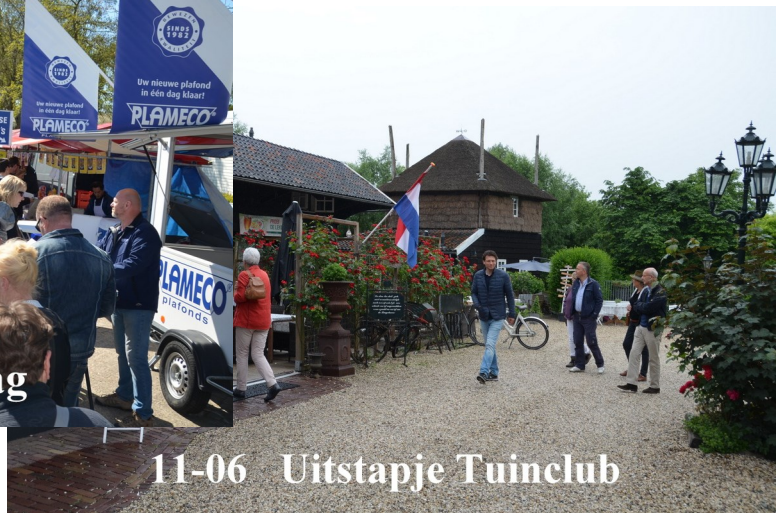
11-06 Uitstapje Tuinclub