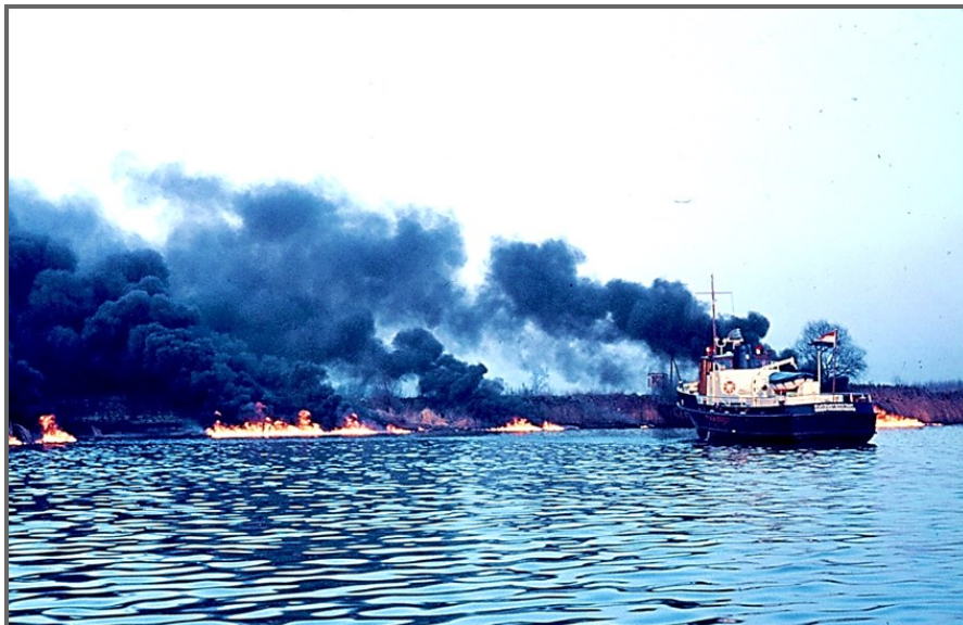
Enorme rookwolken tussen de PNEM en Drimmelen. RWS Volkerak probeert te blussen.

Op 27 december 1970 scheurde er bij de Amercentrale in Geertruidenberg een opslagtank open met ruim 16.000 ton stookolie, waarvan 8.000 tot 10.000 ton in de rivier de Amer terecht kwam. Bij het openbarsten van de tank werden bommen, die op de weg van de oliestroom stonden, gewoon uit de grond gerukt. Deze bommen zijn nooit meer teruggevonden. De olie is door de kracht in de rivierbodem terecht gekomen. Er was echter een gelukkige omstandigheid. In 1970 was het Haringvliet afgesloten, met als gevolg dat eb en vloed bijna geen invloed meer hadden op de waterbeweging op de Amer. Het verschil was nu nog ongeveer 35 cm. Eén van de eerste personen die werd getroffen door deze ramp, was Cees de Jongh met het m.s. "Clemence" uit Geertruidenberg (foto onder). Hij vertrok