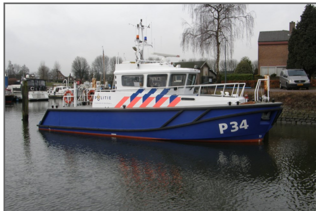
2011- Waterpolitie verdwijnt