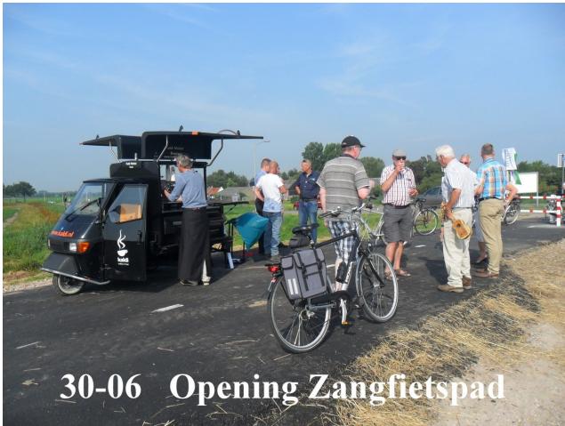
30-06 Opening Zangfietspad