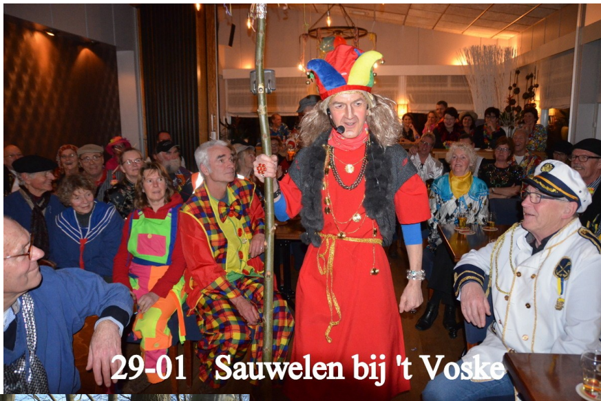
29-01 Sauwelen bij 't Voske