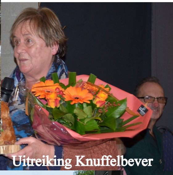
08-01 Uitreiking Knuffelbever