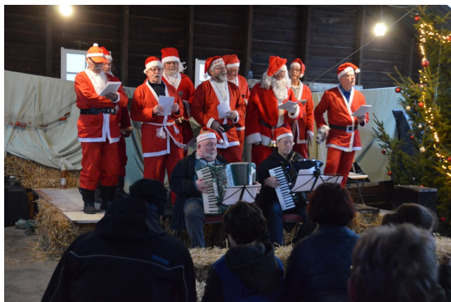
10-12 Kerst in de Zwarte Schuur